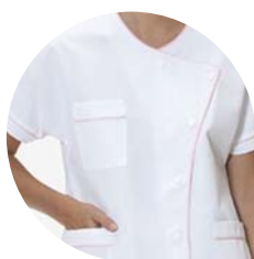
Infirmière puéricultrice Liseré rose

A votre arrivée dans le service, un professionnel soignant vous conduira dans votre chambre. Vous reconnaîtrez les différentes catégories du personnel à leur tenue :