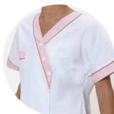
Auxiliaire de puériculture