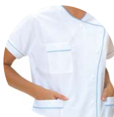
Infirmière(e) Liseré bleu