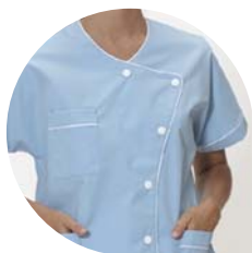
Agent de service hospitalier