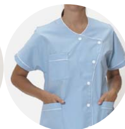
Agent de service hospitalier