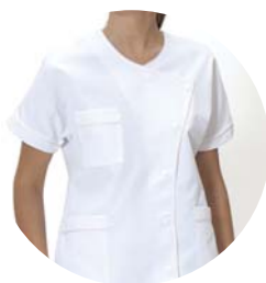
Sage femme Tenue blanche

Vous reconnaîtrez les différentes catégories du personnel à leur tenue :