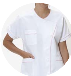
Infirmière puéricultrice Liseré rose