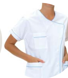
Infirmier(e) Liseré bleu